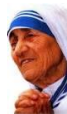
MADRE TEREZA DE CALCUTÁ

ALÉM DE IRMÃ DULCE E MADRE TEREZA DE CALCUTÁ QUE OUTROS EXEMPLOS A FAVOR DA VIDA VOCÊ CO- NHECE?